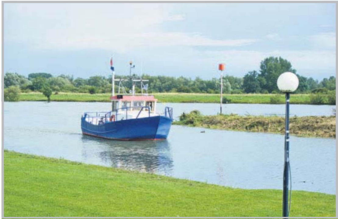
Wat leuk, een pontje voor mij helemaal alleen! Inzet: als je op de knop drukt, komt het Kozakkenveer eraan.

Redacteurs van het Nederlands Dagblad fietsen deze zomer in estafette door Nederland, kiezen zelf hun route en doen daarvan verslag. Op een treinstation vindt 's ochtends de overdracht plaats.